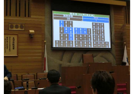
電子採決システム