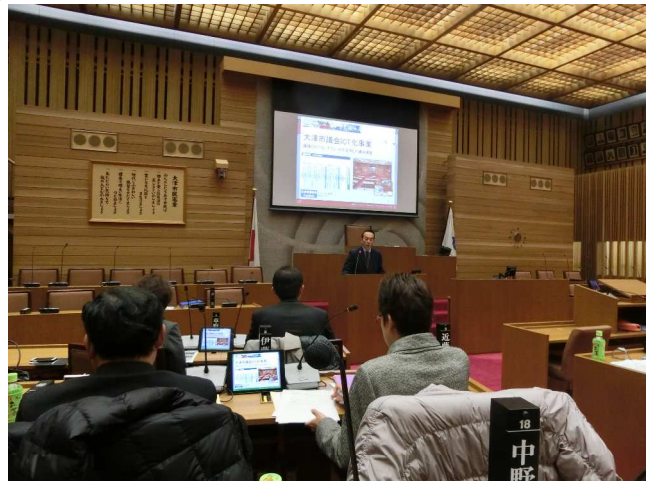
タブレット端末を使用した資料説明