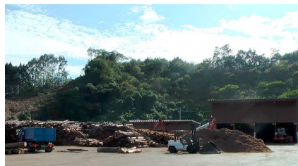
真庭バイオマス集積基地第二工場