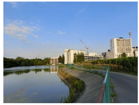
2か所目の施設が検討された 濁池。建物の影がわかりやすい。

削 図書自動貸出返却機を 加にな画(答く有中 の後あれが自状る 間えろな え分いはく工