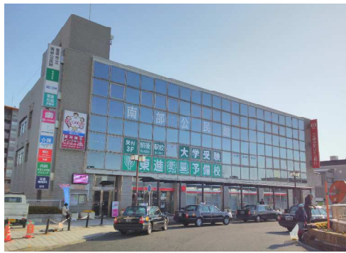
前後駅前ビルにある南部公民館

り保模い既保 (答) のて今あしが行の ま組預イは に今方設 も入く育まり少 保育ママ等検討を 、育保た存育再 ) かの後りた小っ資独すみかん `保近あ針はし発れ `所す2しこ 保育ママ等検討を 前も育の土就 (答) 同の `まり規て格自 °作るを国育いと原か生などに °0すこり 保育ママ等検討を 向きと `施確職 いよ地すし模認をに り側定もマと施な則しいこ入そ0つの 保育ママ等検討を に保設保支 健康 進むに型 `い保し研育 進安 `綱やうのてし公いい空なて以加 ` 保育ママ等検討を に保設保支 健康 進むに型 `い保し研育 進安 `綱やうのてし公いい空なて以加 ` 保育ママ等検討を に保設保支 健康 進むに型 `い保し研育 進安 `綱やうのてし公いい空なて以加 ` 保育ママ等検討を に保設保支 健康 進むに型 `い保し研育 進安 `綱やうのてし公いい空なて以加 ` 保育ママ等検討を